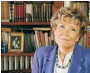
Dacia Maraini

Das Mädchen und der Träumer , der neueste Roman von Dacia Maraini , folgt einem Traum, der Wirklichkeit wird - und einem Mann, der nicht aufgeben kann: Nach dem Tod der eigenen Tochter verfolgt der Lehrer Nani wie besessen die Spur eines verschwundenen Mädchens und zieht damit den Argwohn seiner Mitmenschen auf sich. Ein überwältigender Roman über Verlust und Menschlichkeit, berührend und fesselnd, den die Grande Dame der italienischen Literatur in Hamburg präsentiert. (8.11.)