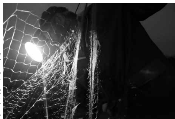
Fischer am Gardasee

Für das Projekt AliMentum haben sich fünf italienische Fotografinnen - Vincenzo Ciccarello, Lino Massolin, Giulia Pasqualin, Daniele Sordi und Giuliano Teso - Gedanken über Lebensmittel gemacht und ihre Produktion, Verarbeitung, Vermarktung, Zubereitung, den Konsum und die Verschwendung dokumentiert. Entstanden ist daraus die Fotoschau AliMentum , die den Betrachter dazu motiviert, den eigenen Umgang mit den „Mitteln zum Leben“ zu überdenken. (20.11.2017 – 13.1.2018)