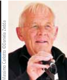
Massimo Carlotto