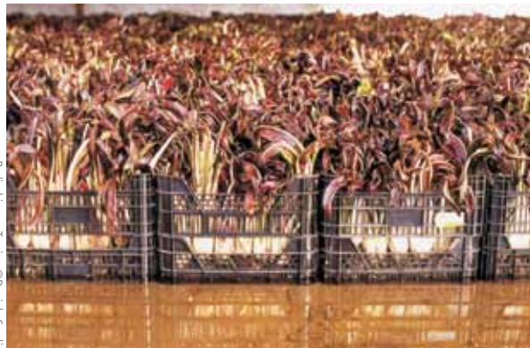
Radicchio aus Treviso

Für das Projekt AliMentum haben sich fünf italienische Fotografinnen - Vincenzo Ciccarello, Lino Massolin, Giulia Pasqualin, Daniele Sordi und Giuliano Teso - Gedanken über Lebensmittel gemacht und ihre Produktion, Verarbeitung, Vermarktung, Zubereitung, den Konsum und die Verschwendung dokumentiert. Entstanden ist daraus die Fotoschau AliMentum , die den Betrachter dazu motiviert, den eigenen Umgang mit den „Mitteln zum Leben“ zu überdenken. (20.11.2017 – 13.1.2018)