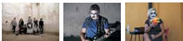
„Azdore“