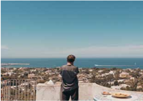
Szenenfoto aus dem Kurzfilm „Lypso“ von Vincenzo Capalbo

Erzählt aus der Sicht eines kleinen Jungen, in einer bestechenden Mischung aus augenzwinkernder Selbstironie und liebevoller Tragikomik, setzt der Film all jenen ein hochachtungsvolles Denkmal, die zwischen 1970 und 1990 im Kampf gegen das organisierte Verbrechen in Sizilien ihr Leben lassen mussten. (23.10.)